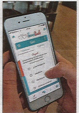
L'application propose des quiz et des conseils pour aider les couples en difficulté.

(1) La divortialité est la propension au divorce d'une population.